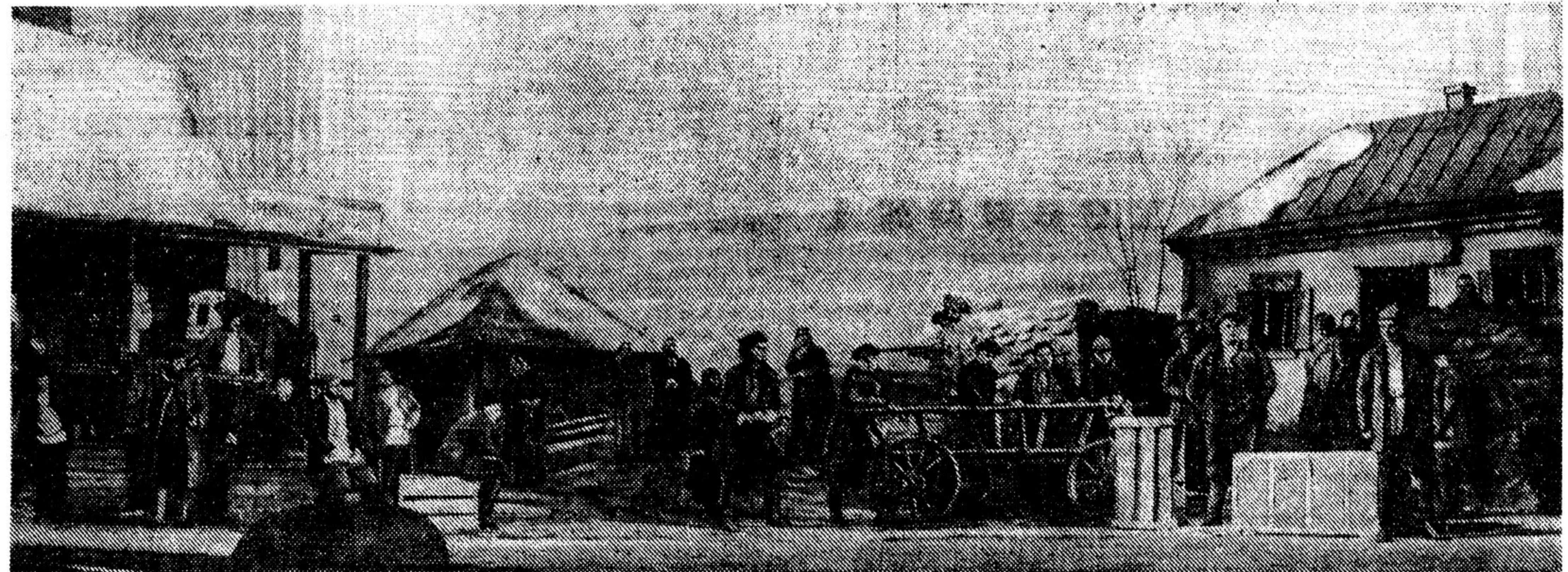
26 октября в Государственном ордене Ленина Академическом Большом театре СССР состоялась премьера оперы композитора И. Держинского «Поднятая целина». На снимке: вторая картина первого акта оперы

Не знаю, в какой степени удался нам этот спектакль, но готовили мы его полные подлинного горя и искреннего желания создать настоящую советскую оперу.